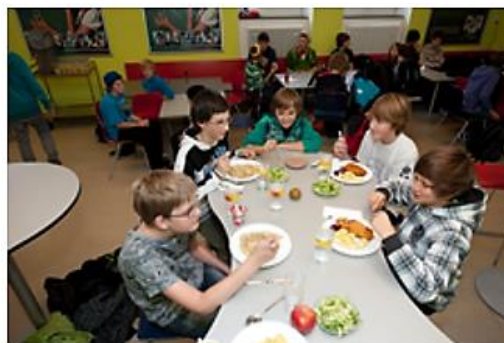
Foto: Mittagessen im Schulbuffet