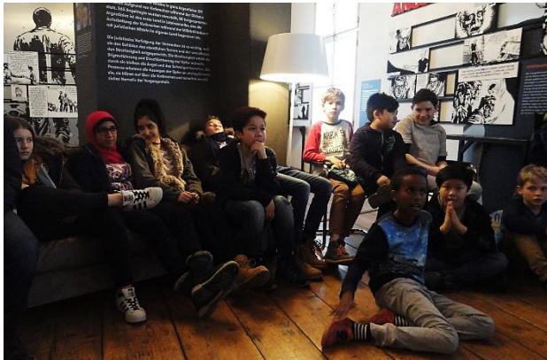
Vortrag im Literaturhaus