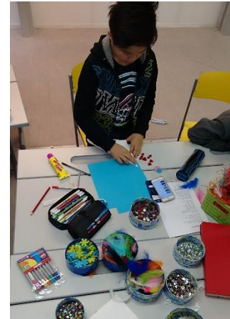
Gestalten von Billets